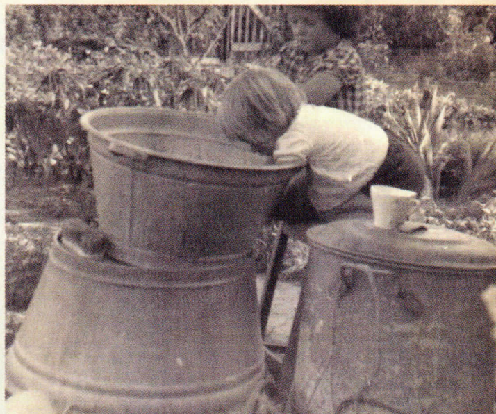
Voor de kinderen was de tuin één groot speelparadijs.

vereniging ontving: "Dat heette meen ik de Amateurtuinder, daar stonden geweldig interessante dingen in."