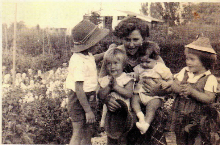
Het hele gezin was graag op de tuin.